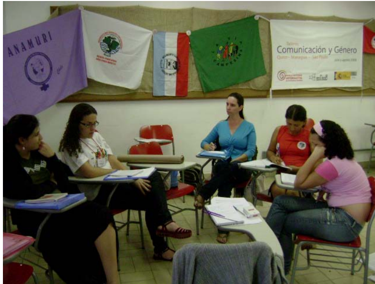
Trabajo en grupo (Cono Sur)

Se constató que en los medios propios, hay una mayor sensibilidad a la problemática de las mujeres, aunque no siempre está presente un enfoque de género.