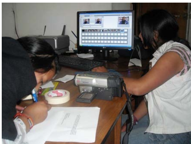
Edición en Video