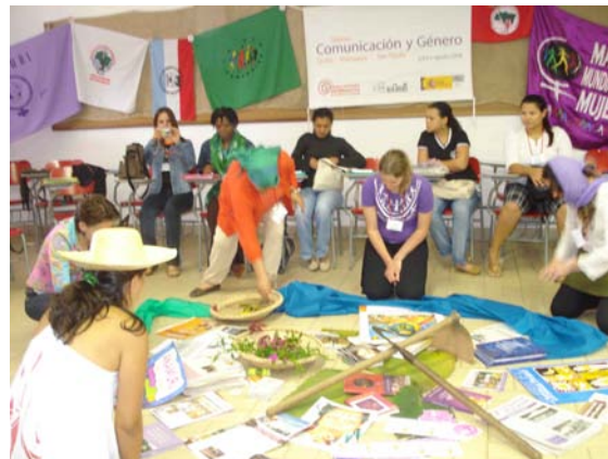
Taller Cono Sur