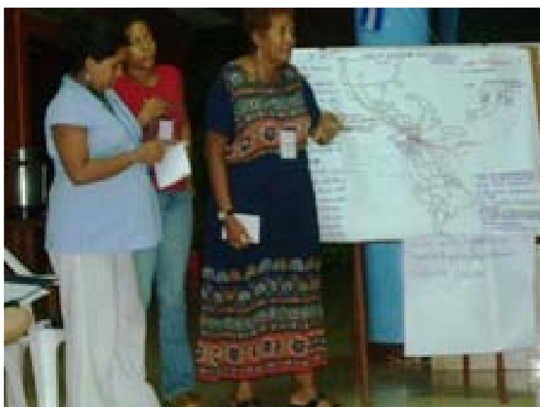
Presentación flujos comunicativos Red de Mujeres Afrolatinas y caribeñas

Se partió de una mirada a los flujos de comunicación, con la pregunta: ¿cómo operan esos circuitos de comunicación al interior de nuestras organizaciones y hacia la sociedad? A partir de un dibujo, las participantes comenzaron a examinar cómo se construye esa práctica comunicativa en la acción cotidiana.