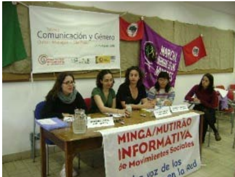
"Rueda de prensa" Taller Cono Sur

En los tres talleres este ejercicio fue muy apreciado. Se vio, por ejemplo, la importancia de estar bien preparadas: con discurso y con datos para responder las preguntas, y con práctica previa para responder -o sortear- preguntas incómodas; evitar caer en celadas; cómo superar -o disimular- el nerviosismo; la importancia de la expresión corporal y la forma de vestir; entre otros aspectos.