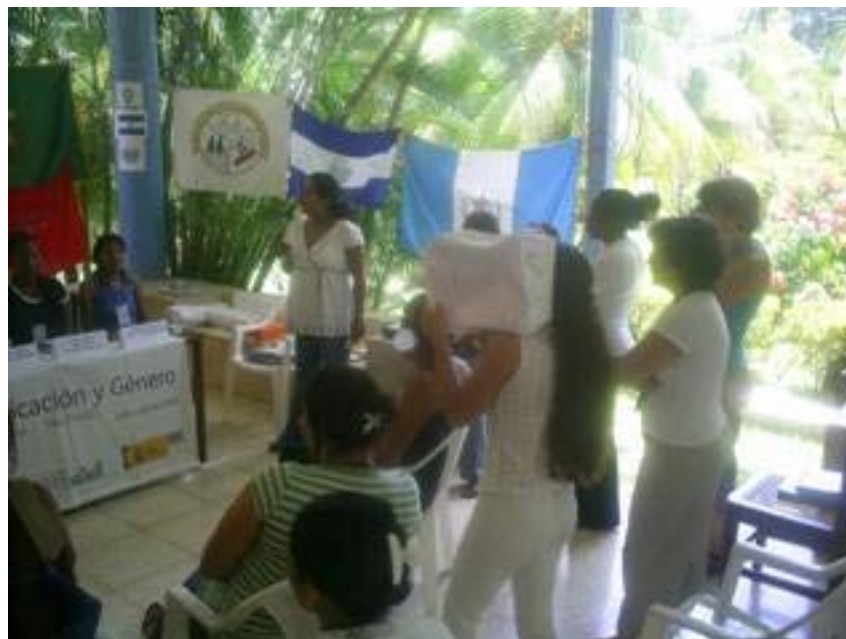
"Rueda de prensa" Taller Mesoamérica y Caribe

Este ejercicio se dirigía a adquirir destrezas para aprovechar mejor los espacios que se consiguen en los medios masivos: en ruedas de prensa o entrevistas. Permitió identificar aciertos, errores y desafíos que tienen los portavoces al enfrentarse a los grandes medios, y estar mejor preparadas para responder las preguntas. También se vieron criterios para la preparación y conducción de la rueda de prensa.